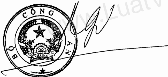
Phạm Quý Ngọ

KT. BỘ TRƯỞNG BỘ GIAO THÔNG VẬN TẢI THỨ TRƯỞNG